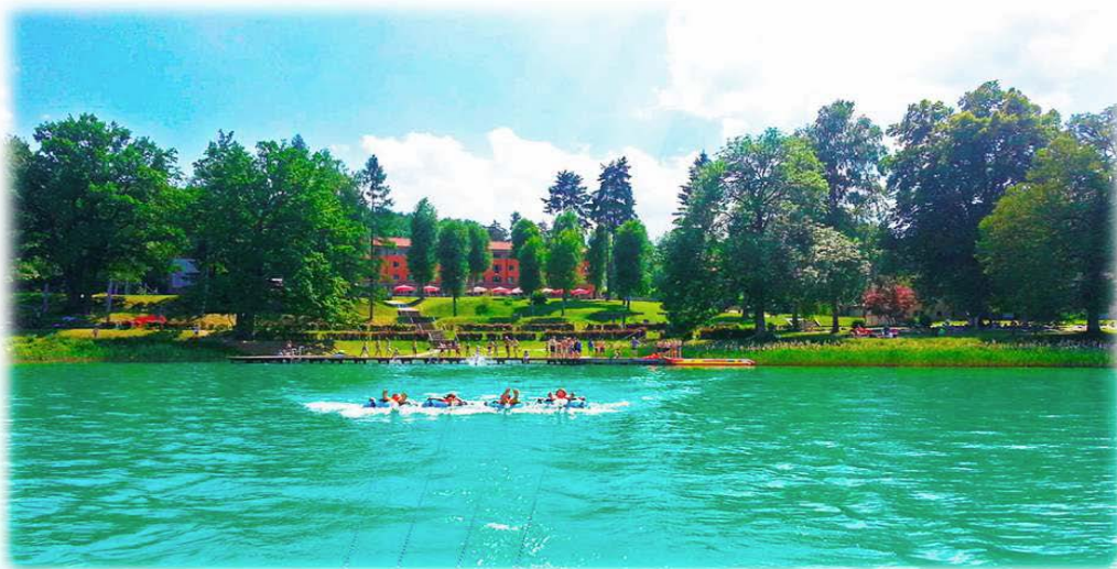
Ansicht des Jugend- und Familiengästehaus Cap-Wörth